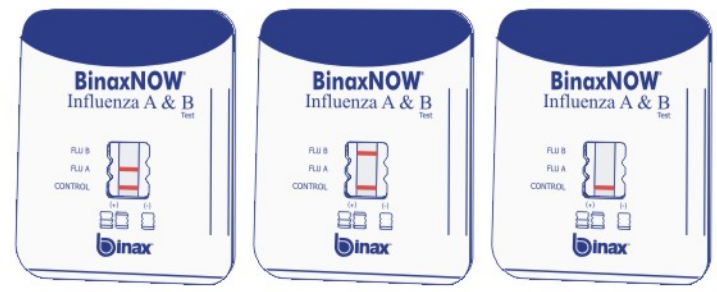
positiver Test auf Influenza A positiver Test auf Influenza B negativer Test

Entfernen Sie den braunen Streifen von Karte und schließen Sie die Karte fest.